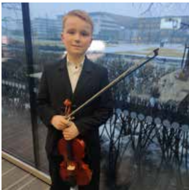
Kuva: Pekko Lindblom